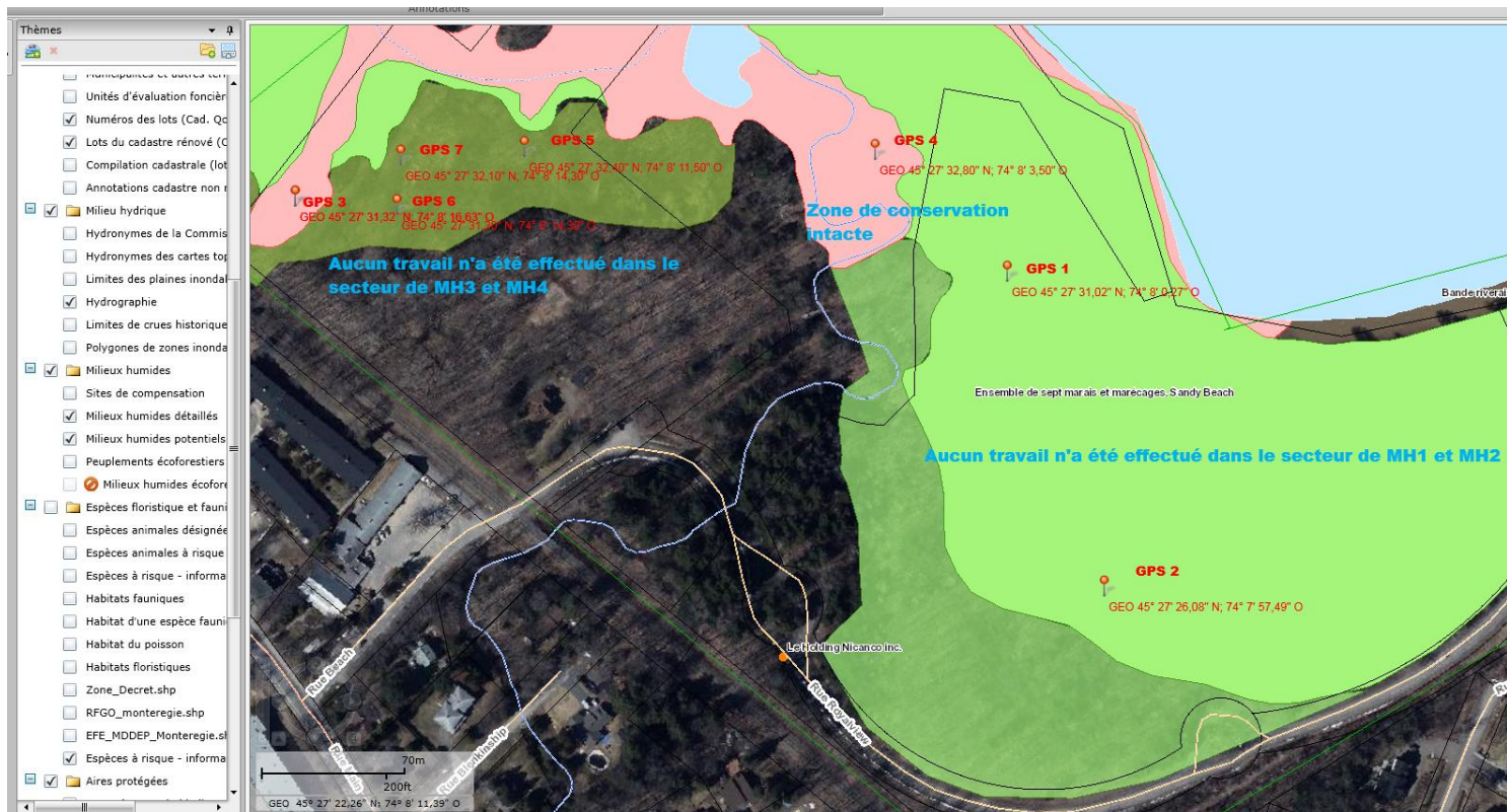
Orthophoto de l'atlas géomatique du MELLCC : couleurs vertes et roses= milieux humides potentiels et détaillés